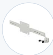
VESA 扫描器支架 WF-SBRKT-VESA