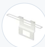
笔记本电脑固定支架 WF-CLT-SECBRKT