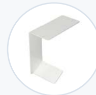
Zebra QLN220 打印机支架 WF-PBRKT-ZQLN2