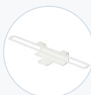
笔记本电脑轮架安全 支架 WF-RLT-SECBRKT