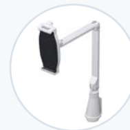
平板电脑平面支架 AM-TABMNT-S