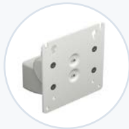
倾斜/旋转式 VESA 支架 WF-VESA-MNT