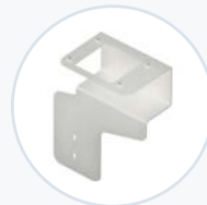
扫描器托架支架, CODE 2600 WF-SCNBRKT- CD2600