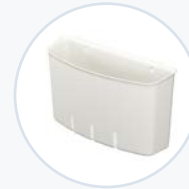
后置耗材篮, 聚合物 WF-RSUPBASK-P