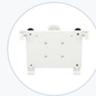
倾斜/旋转式平 板电脑支架 WF-TAB-MNT