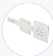
电子签名板, VESA 支架 WF-SIGNPAD-VESA