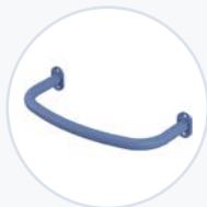
钢制加长后置把手 WF-EXRHAND