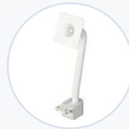
轻型 VESA 支架 WF-VESA-MNT-LT