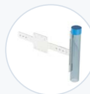
杯托, VESA 支架 WF-MEDCUP-VESA