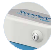
Opzioni di bloccaggio globale e a livello singolo