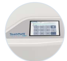
Touchscreen con accesso RFID