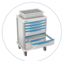
Separadores para cajón intercambiables removibles

Los accesorios proCARE™ le permiten configurar los carros de procedimientos para almacenar, guardar y mantener seguros los suministros y el equipo del que depende día con día.