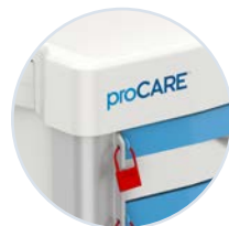
Sello de seguridad inviolable