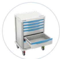
Separador para cajón removible sin divisores